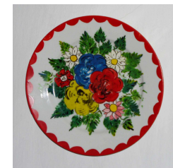
Malované talíře tvořily částou výzdobu valašských jizeb.

Městské informační centrum tel. 577311150