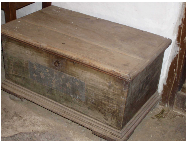
Tato truhla v síni není datovaná. Jako celá dřevěnice potřebuje i ona opravu. Malba v přední části je již jen špatně rozeznatelná. Podle motivu malby se dá předpokládat, že v ní původně byly uloženy peřin.

Z vnitřního vybavení je velmi cenná původní truhla na šaty s datací 1795. Další původní truhly jsou umístěny na půdě. Část původní jizby zabírá černá kuchyně se samostatným vstupem ze světnice. Původní pec však byla již bohužel zbourána.