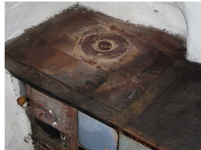
Černá kuchyně se nyní nepoužívá

K trvalému bydlení již budova není určena, neboť současné hygienické normy a standardy to již neumožňují a instalace moderních hygienických zařízení by narušila historický charakter dřevěnice.