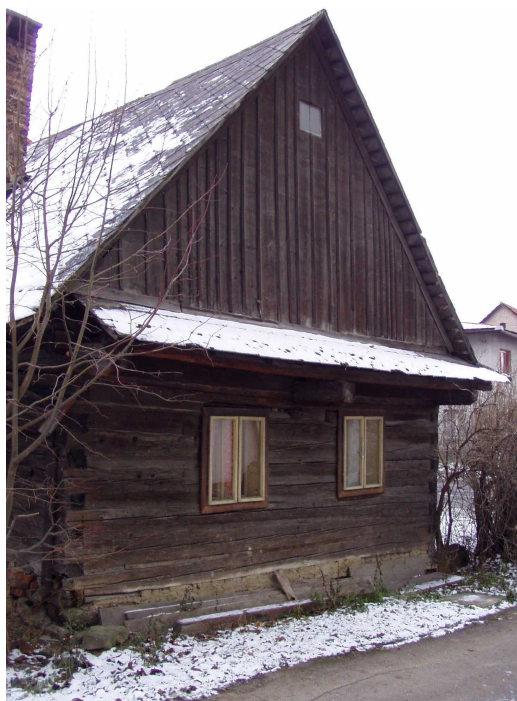
Boční pohled na dřevěnici od gymnázia