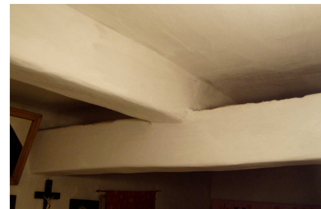
Podélné a příčné nosné trámy leží na sobě. Jsou zpravidla dubové a musí být dostatečně silné, aby unesly celou váhu střechy. V dřevěnici č. 62 to vidíme nejlépe.

Síň ve střední části tvořila vstupní část do domu a je v ní i schodiště na půdu, u starších typů i černá kuchyně. Komora se používala k uskladňování zemědělských produktů, oděvu i nářadí.