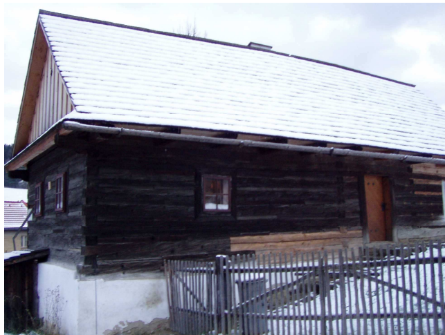
Současná podoba dřevěnice č. 7