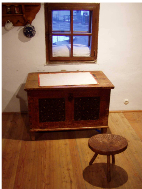
Do truhly se ukládalo oblečení. Skříň přišly až později

Takto zrekonstruovaná dřevěnice byla koncem roku 2002 zpřístupněna veřejnosti. Na požádání vám ji předvedou pracovníci Městského muzea či ZO ČSOP KOSENKA