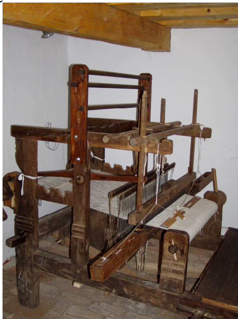
Tkalcovský stav je plně funkční. Dříve byl snad v polovině chalupy

Na počátku zvýšeného zájmu o chátrající stavbu v roce 2000 bylo zjištěno, že s usedlostí je už od konce 16. století spojen rod Pivečků. Obuvnický odborník ze Slavičína Jan Pivečka (1919-2004) založil v listopadu 1996 Nadaci Jana Pivečky.