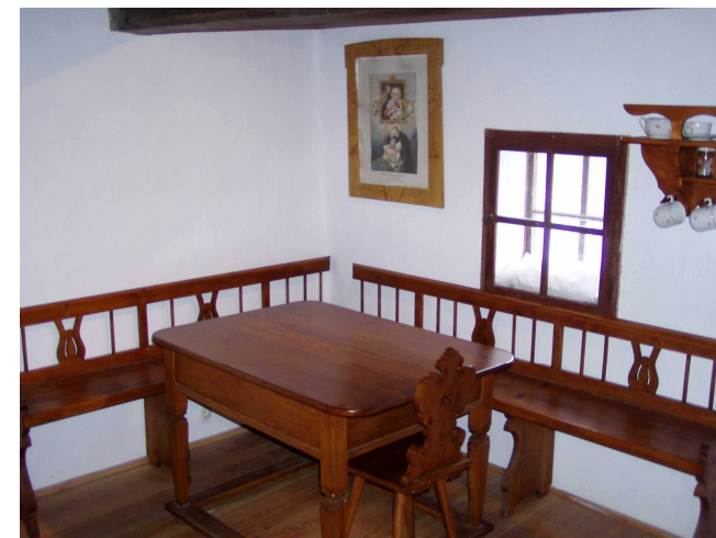
Na lavicích se sedělo i spalo...

Dřevěnice neslouží k trvalému bydlení, neboť především hygienické standardy dnešní doby to už neumožňují a jejich zbudování by narušilo historický ráz stavby.