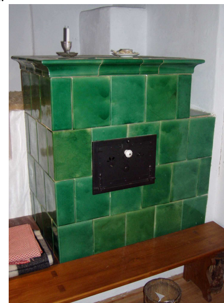
Kachlová pec, zdroj tepla v každé novější dřevěnici

Síň ve střední části tvořila vstupní část do domu a je v ní i schodiště na půdu, u starších typů i černá kuchyně. Komora se používala k uskladňování zemědělských produktů, oděvů i náradí.